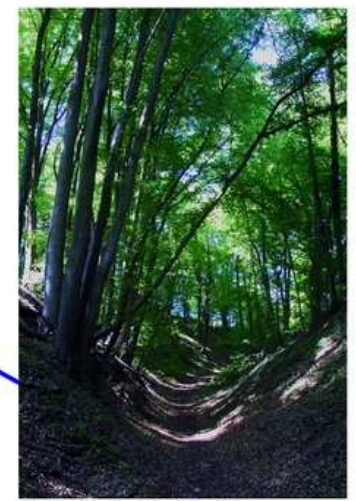
chemin d'arrivée des frondeurs baléares... ?